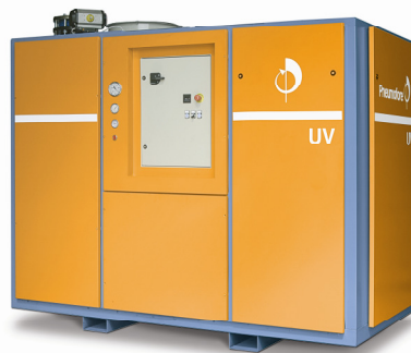
UV50 Vakuumpumpe mit 2700 m 3 /h Kapazität

Mit der dritten Generation von Schweizer Ingenieuren in der Firma feiert Pneumofore 85 Jahre Tätigkeit. Das familiengeführte Unternehmen, welches für ein genaues Projekt-Management steht und Vakuumsysteme mit den absolut niedrigsten Lebenszykluskosten bietet, präsentiert sich in diesem Artikel.