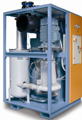
UV16 mit 970 m 3 /h Kapazität